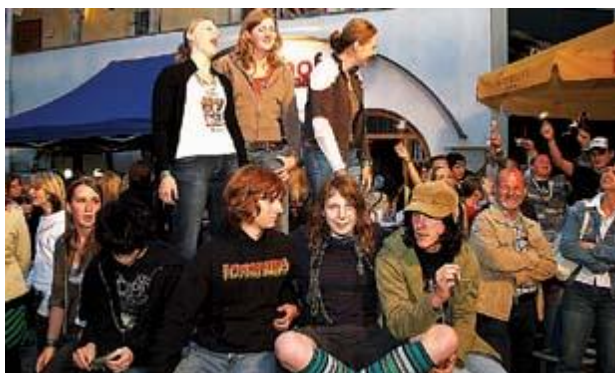
Partystimmung bis spät in die Nacht.